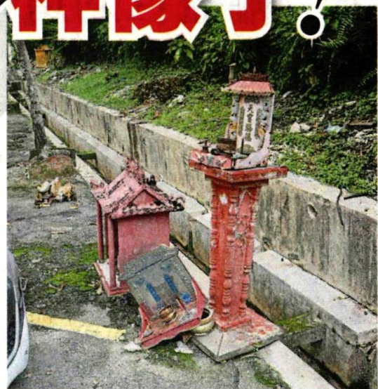
■一般上，当一个地方出现第一个废弃神像，数量就会越来越多。

她说，以前每次有非法垃圾堆，公众的矛头都指向外劳，但是实际上，有些卫生问题也涉及本地人。