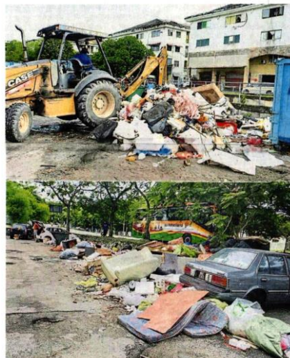
■班丹美华12座廉价租屋所面对的垃圾问题越来越严重，市议会只能定期使用铲泥机把堆积如山的垃圾铲走。

“比如说，出售水果的人，可以把他们丢弃掉的水果，转到社区菜园做有机肥料，餐饮业者可以把废弃的食油出售给承包商进行再回收，其实有很多商业和工业垃圾是可以再回收，如果大家愿意配合，就会减少很多垃圾。”