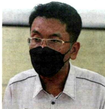
Najmuddin says with assessment increase, MPKj will be able to serve residents better.

by 25%, a standard terrace house will only pay 80sen, which is still much lower compared to MPKj's daily maintenance cost.