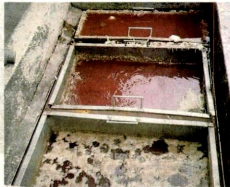
SISA cucian lantai dan proses ayam yang dikesan dibuang di longkang sehingga mencemarkan persekitaran.

"Sebaliknya, kilang itu hanya menggunakan sistem perangkap