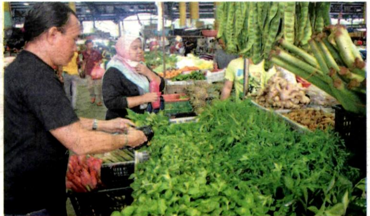
SAYURAN yang dijual PKPS di Pasar Borong Selangor, Seri Kembangan semalam.

"Sebagai contoh, kita akan menjual sayur pak choy hanya RM3.50 per kg berbanding harga