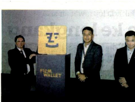
KETUA Pegawai Eksekutif Perbadanan Kemajuan Filem Nasional Malaysia, Prof. Md. Nasir Ibrahim (kiri) menghadiri pelancaran perkhidmatan pawagam atas talian, Film Wallet Premium Video-On-Demand di ibu negara baru-baru ini. Servis itu dijangka bakal merevolusikan dan meningkatkan pengalaman pengguna dengan kemudahan tontonan filem di persekitaran yang selamat dan selesa.