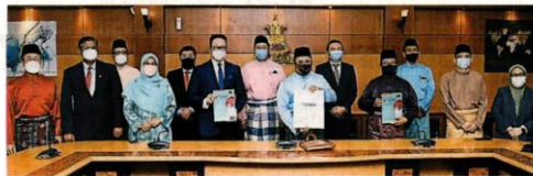
雪州大臣阿米鲁丁 (右六) 在众行政议员陪同下，展示雪州 2022 年财政预算案。

户头中的现金和投资、信托户头和借贷户头。” 他说，截至 2021 年 11 月 23 日，州政府的行政开销达到 81.91% (9 亿 9932 万令吉)，发展开销则因行动管制令和标准作业程序限制发展计划的限制，仅达 54.49% (6 亿 5623 万令吉)。