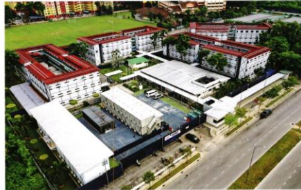
MNC Canada's purpose-built certified labour quarters

The Covid-19 pandemic has uncovered several deep-rooted issues in the country, one of which is the existence of a large number of low-skilled foreign workers in labour-intensive industries. The accommodation for these workers is normally arranged by their employers. Unfortunately, many of the dormitories are cramped, creating an undesirable living environment. There are regulations on workers' accommodation, but the lack of enforcement has made them ineffective. In a recent publication on workers' dormitories, Knight Frank Malaysia observes that most industries use terraced houses, apartments, shophouses and makeshift accommodation to house their workers, while professionally managed dormitories are unexplored propositions. "Most of these types of housing were crowded and had poor sanitation, leading to many social issues that have burdened the community for years. The perception of higher cost and non-standard guidelines by local authorities in different states have also led to years of resistance from industry players to provide dedicated workers' accommodations," it says, adding that the lack of awareness and accountability has compounded the problem.