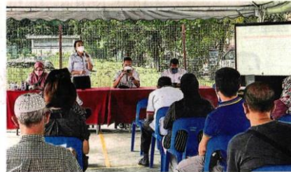
■安邦再也市议会在班丹美华民众会堂，为业者进行解说及对话会。