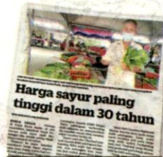
KERATAN Kosmo! semalam.

dagangan Dalam Negeri dan Hal Ehwal Pengguna (KPDNHEP) mengesahkan kenaikan harga sayur-sayuran di pasaran tempatan ketika ini ada kaitan dengan peningkatan harga baja dan racun di pasaran dunia.