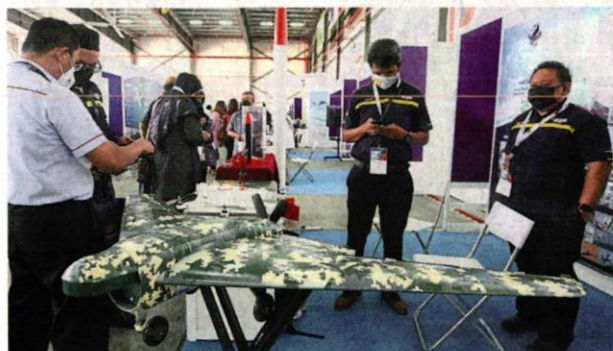
■多名来自国外的航空业者参展。

航空行動方案鞏固雪州經濟 雪州大臣拿督斯里阿米鲁丁说，邓章钦领导的委员会与雪州投资促进机构在2019年底，推出的“雪州2020-2030航空行动方案”，是一项全方位的计划，以巩固雪州在航空经济领域的领先优势。 “虽然我们在去年面对疫情来袭，但我们不曾放弃，投资促进机构依然努力保持前进，维持雪州航空业上的稳健增长。” 他以录影的方式，在开幕仪式上致词时指出，他说，2021雪州航空展旨在让此行业“重启”，重建和刺激航空业相关经济。 另外，他说，在疫情期间，许多航空相关领域都遭受重创，但也有些相关行业迅速反弹，如商务航班是其中之一。